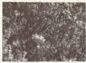
◇ 市花 개나리

○ 이와 관련하여 독립기념관과 서대문 독립공원에서는 장군의 뜻과 공적을 기리기 위하여 별도의 전시실을 마련하여 관련자료와 사진을 8월 한 달간 전시할 예정임