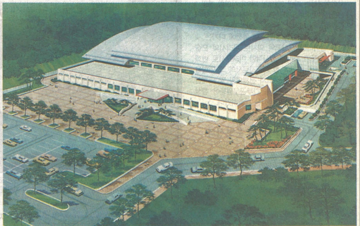
내년말 석사동 호반체육관 인근에 건립될 '춘천시내수영장' 조감도(관련기사:7면)

한편 정보화근로사업은 IMF로 인한 경기침체 및 구조조정으로 실직한 대졸미취업자 전산인력 컴퓨터그래픽스 정보처리사 등 고급인력의 구제를 위해 정보통신부와 한국소프트웨어진흥원이 공동으로 실시하고 있는 정부차원의 사업이다.