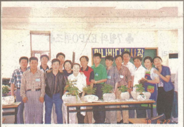
춘천정보센터 '작은소망의 집' 아나바다 행사 퍼 정신질환자를 위한 '작은 소망의 집'에서는 지난 6월22일 아나바다운동을 실시했다. 이날 행사에는 가족과 회원 80여명이 참가하여 의미있는 시간을 가졌다. (정신장애문의 ☎ 244-7574, 241-4256, 250-3576)