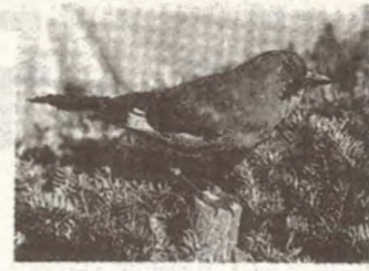
◇ 市鳥 산까치