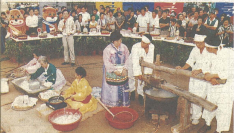
재래의방법으로 막국수를 뽑아내고 있는 모습(작년대회중 KBS의 6시 내 고장에 생방송으로 중계하는 장면)

할 예정이다. 춘천시와 KBS 춘천방송총국이 주최하는 제4회 춘천막국수축제에는 행사 5일간 전통막국수재현, 무대공연(마임, 댄싱공연, 국악, 무용, 언더그라운드공연 등), 수상스포츠, 백일장, 사생대회 등이 풍성하고 다채롭게 펼쳐진다.