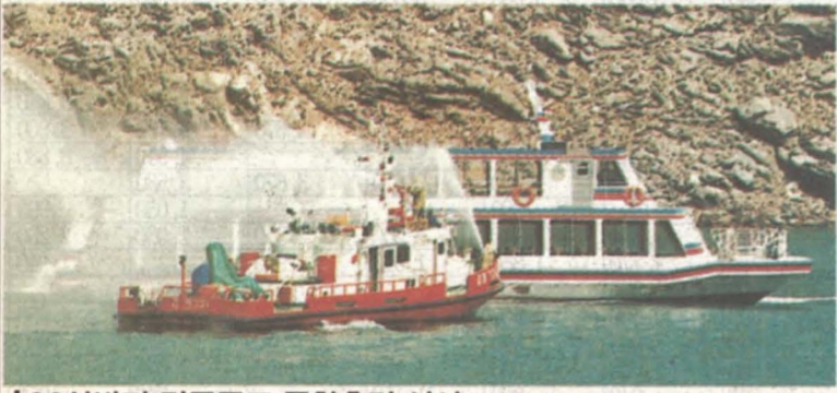
'99상반기 긴급구조 종합훈련 실시 춘천시와 춘천소방서가 공동주관한 '99상반기 긴급구조종합훈련이 지난 6월 28일 오후 2시 소양호에서 실전을 방불케 하며 실시됐다. 이날 훈련에는 합천구 춘천부시장, 지방별 춘천소방서장을 비롯 4백여명이 참석했다.