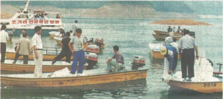
쓰가리 인공종묘 방류행사 실시 쓰가리 인공종묘 방류행사가 지난 6월 15일 복산면 물노리 소양호에서 국립수산진흥원 청평내수면연구소 주관으로 실시됐다. 이날 방류된 쓰가리치어(체장 2cm정도)는 1만마리이다.