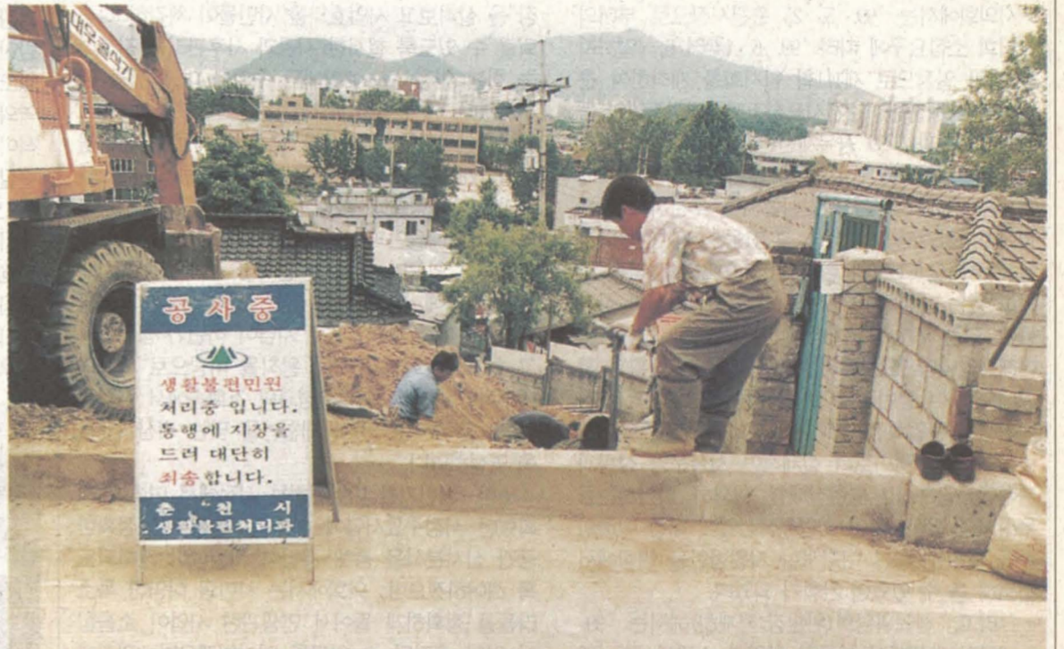
생활불편처리 즉시 처리해 드립니다

춘천시에서는 주민생활에 불편을 느낀 사항을 접수받아 즉시 처리해주고 있어 큰 호응을 얻고 있다. 또 어려운 이웃에게는 장례용품도 무상으로 대여해 주고 있다.