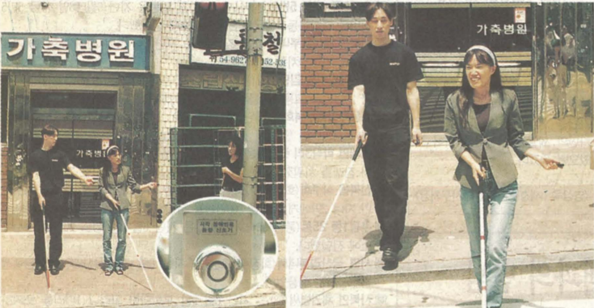
시각장애인에게 횡단보도 음향신호기 리모컨 지급, 도움취

시청 민원실에 설치된 민원증명자동발급기(일명 키오스크)가 민원인들로부터 큰 호응을 얻고 있다. 4개월여동안 1만 1천여건이 넘는 발급건수를 기록하고 있다. 이 발급기로는 토지대장 외에 임대대장 토지가격확인원도 낼 수 있다.