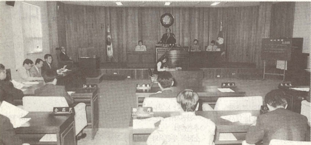
◇춘천시의회 제111회 임시회가 지난 6월 1일부터 4일까지 4일간의 일정으로 열렸다. (사진은 시의회 본회의장 모습)

또한, 상반기를 마무리하는 시점에서 연초에 계획했던 시정주요사업에 대해서, 집행부는 정확한 중간 심사분석을 통해 사업이 차질없이 진척되도록 해야하겠으며, 의회에서는 시민의 다양한 목소리들을 정확하게 들어서 민생관련 사업이 소홀함이 없이 추진될 수 있도록 해야겠으며, 의회에서는 시민의 다양한 목소리들을 정확하게 들어서 민생관련 사업이 소홀함이 없이 추진될 수 있도록 각별히 관심을 기울여 줄것을 당부하였다.