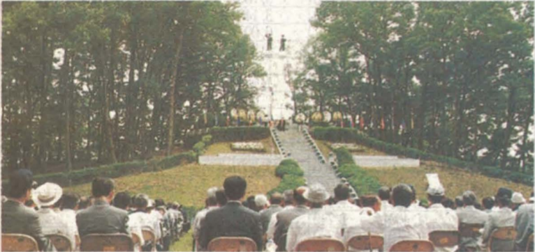
제44회 현충일 추념식 행사 제44회 현충일 추념식이 지난 6월 6일 오전 10시 우두산 총열탑에서 김진선 지사, 배계실시장을 비롯 전월군경유가족, 시민 등 2천여명이 참석한 가운데 가진 님들의 넋을 기렸다.