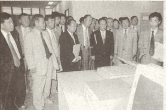
◇춘천디지털스튜디오(CDS) 현지확인 모습