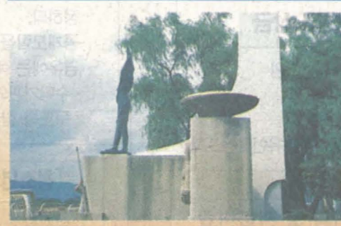
(95년 철거되기 전의 소양2교 옆의 자유수호의 탑 모습)

소양강전투승전기념공원조성사업은 6·25전쟁 당시 북괴군의 남침전략에 결정적 타격을 입힌 소양강전투에서 조국수호를 위해 산화한 호국영령들에 대한 숭고한 애국 충정을 영원히 기념하기 위하여 건립, 착공되었습니다.