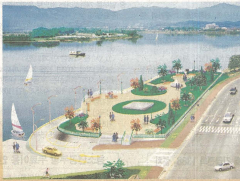
(기념공원의 조감도·내년 6월말 공개될 예정으로 중앙의 기단에는 조형물이 현상공모에 의해 선정되어 세워지게 된다.)