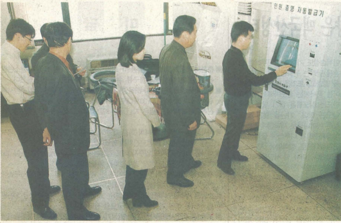
민원실의 토지대장자동발급기 이용 급증

시청 민원실에 설치된 민원증명자동발급기(일명 키오스크)가 민원인들로부터 큰 호응을 얻고 있다. 4개월여동안 1만 1천여건이 넘는 발급건수를 기록하고 있다. 이 발급기로는 토지대장 외에 임대대장 토지가격확인원도 낼 수 있다.