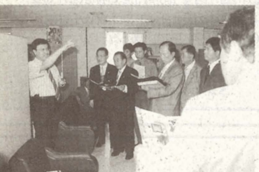
◇게임진흥센터(구 삼천동사무소) 현지확인 모습