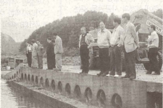
◇남면 가정1리 수해복구 현지확인 모습