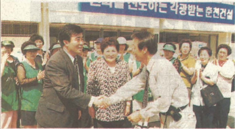
시청직원 증고생활용품 9천여점 전달 시청직원 1,600여명은 지난 6월 11일 그간 모은 증고생활용품(의류, 신발, TV, 냉장고 등)을 종합운동장에서 시새마을부녀회와 바살협에 전달했다