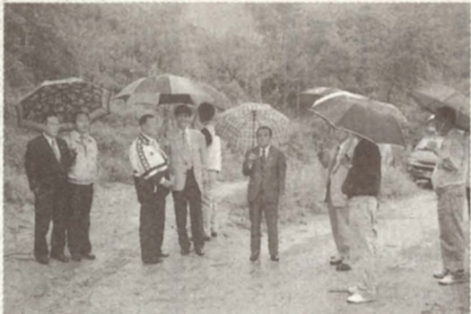
◇남산면 강촌리 은행나무조성 사업장 현지확인 모습