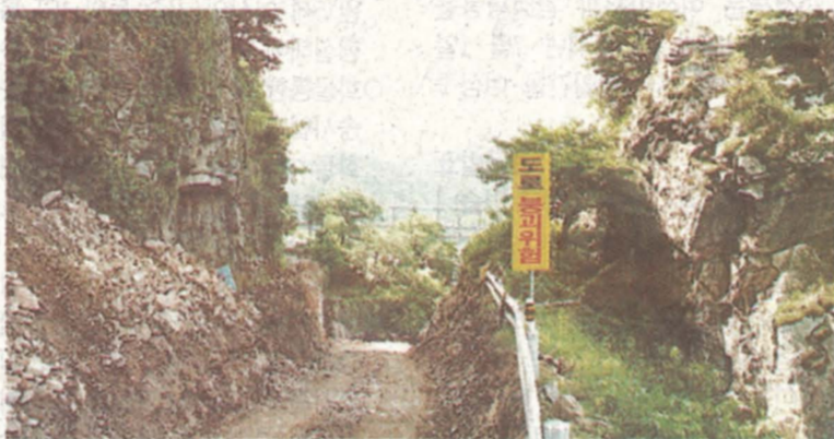
△도로침하에 따른 보수와 노후교량 보수공사 관계로 의암순환도로 일부구간과 신연교 통행이 12월말까지 금지된다.

춘천시 관계자는 「시민 여러분과 춘천을 찾는 외지분들께 불편을 드려 죄송하다.며 「유비무환의 생각으로 대비코자 사업을 시행하고 있다고 말했다.